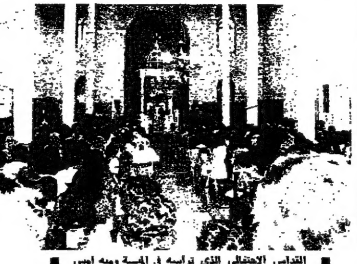
القسا الاحتفالي الذي ترأسه في المية ومية امس

المية ومية - « الانوار » : ترأس صباح امس المطران ميشال حكيم راعي أبرشية صيدا ودير القبر للروم الكاثوليك ، قداساً احتفالياً هو الاول بعد سبيلته مطرانا في بلدة المية ومية حضره جمهور غفير من ابناء البلدة والقرى المحيطة بها . وقد التقى المطران حكيم عظة دعائية الى الحفاظ على التماسك والتضامن في طريق البناء والامبار في ظل السلام والهدوء . كما دعا الى محبة الانسان لكيفية الانسان . في الختام ، تلقي هذه الزيارة التي يتوّم بها المطران الجديد للروم الكاثوليكين ، من ضمن الدعوة لاعادة اللصمة والتخمس التي